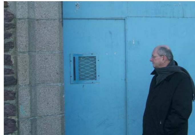
Visite de la prison de Rennes.