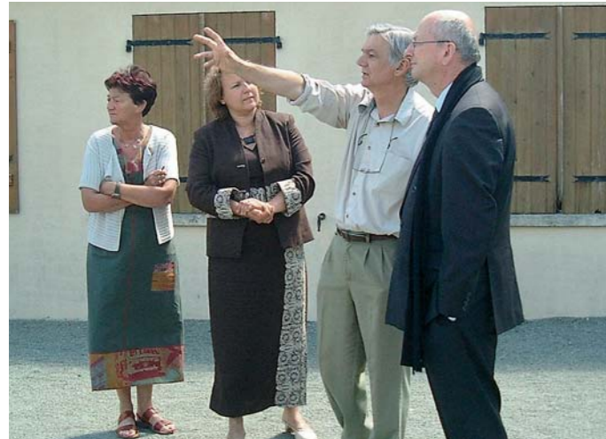
Visite de la MFR de Saint-Aubin-d'Aubigné.