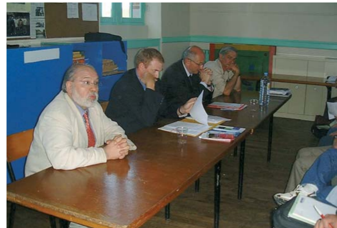
Réunion d'information avec l'URSSAF et les associations.